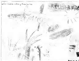
Con muchas matas y flores bonitas